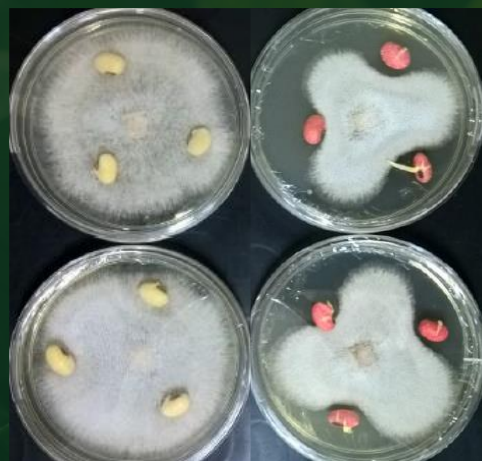
AVALIAÇÃO DE EFICIÊNCIA DE PRODUTO QUÍMICO SOB TRATAMENTO NA SEMENTE.