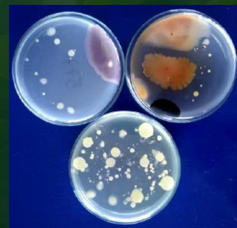
IDENTIFICAÇÃO DE FUNGOS FITOPATOGÊNICOS EM SOLO, PARTE AÉREA, SEMENTES