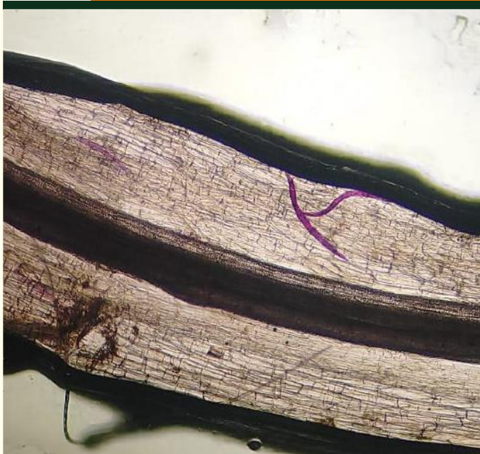
COLORAÇÃO COM FUCSINA ÁCIDA