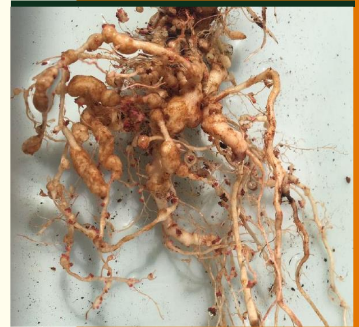
VALIAÇÃO DE INDICE DE GALHA