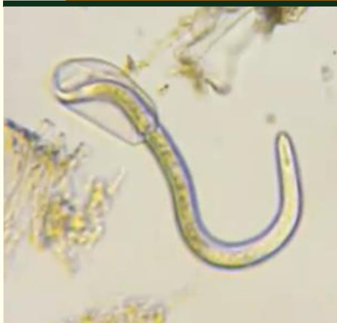
EXTRAÇÃO DE NEMATOIDES POR Jenkins, 1964 e Collen & D'herde, 1972